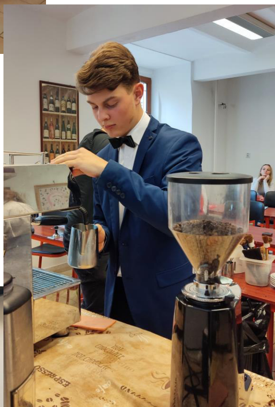
Baristický kurz pro žáky školy