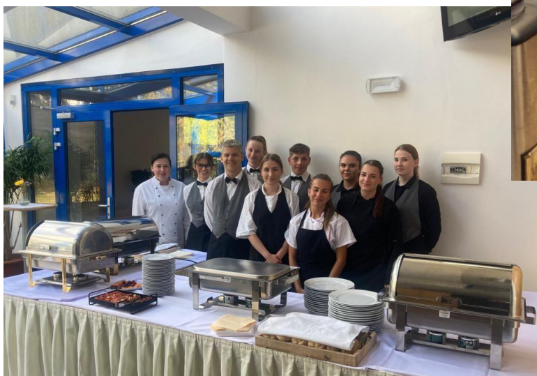
Cateringová podpora akcí Karlovarského kraje